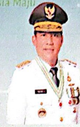
MAYJEN TNI (PURN) YULIUS SELVANUS, SE GUBERNUR SULAWESI UTARA