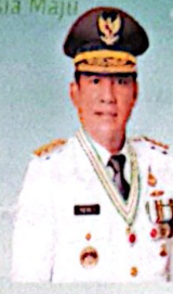
MAYJEN TNI (PURN) YULIUS SELVANUS, SE GUBERNUR SULAWESI UTARA